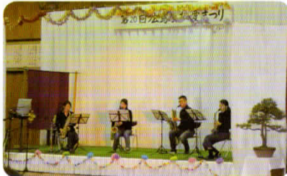
☆素敵なサックス演奏。いつまでも聴いていたかったです。