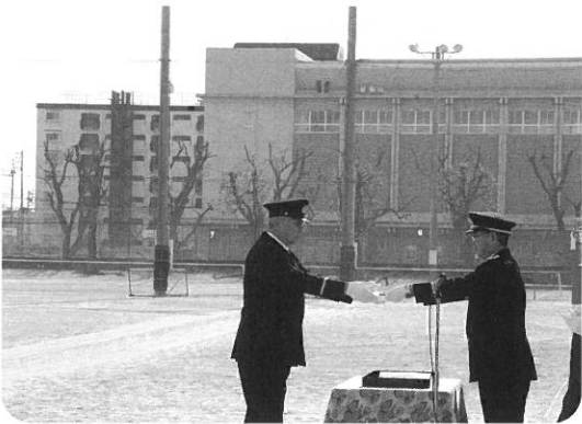
出初式での表彰式