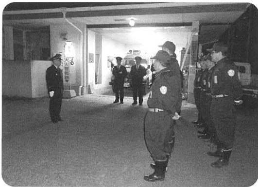
寒い中での特別警戒