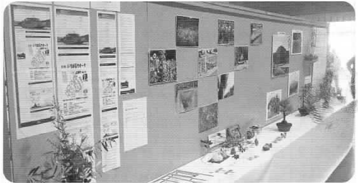
去年の広島ふれ愛まつりの様子です。