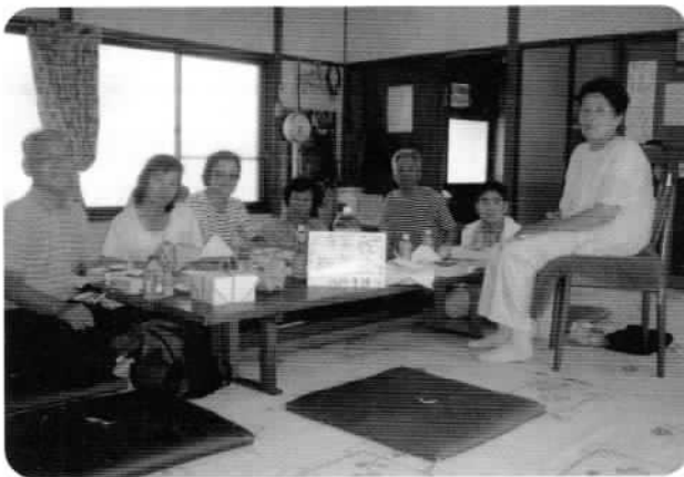
市井地区の敬老会