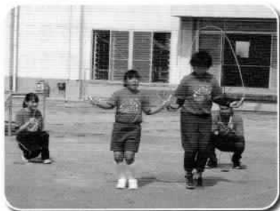
たくさん練習したよ

10月10日(火)にRSKテレビ放送の「あさチャン!」の番組の中で小手島大運動会が取り上げられました。小手島の1人の児童を中心に、交流のある城乾小学校の児童や地域の人々に支えられながら行われたにぎやかな様子が放映されました。