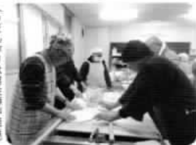
(うどん作りは男性陣が担当)