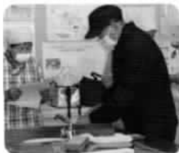
(包丁を研いでいただいたので切れ味抜群！)