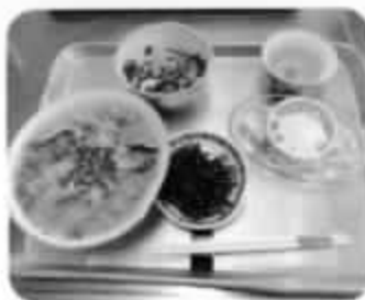
(打ち込みうどん・いんげんとトマトの和風サラダ・ホットグレイプフルーツと美味しく出来ました)