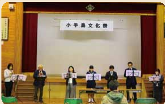
リコーダーの練習に励んだ成果を聴いてね