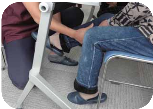
(まずは膝から下を)