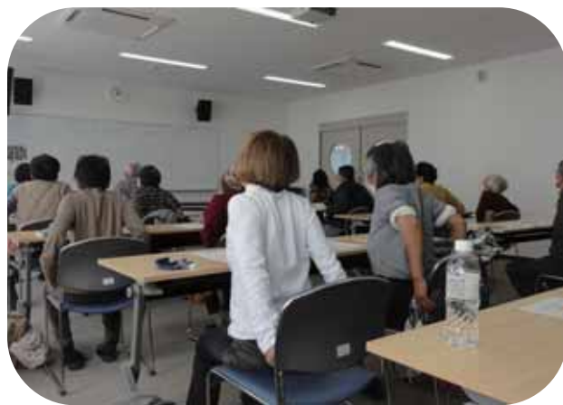
(肩をすくめて、後ろに)