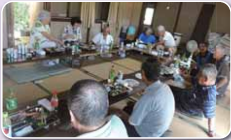
茂浦(上)や立石(下)でも敬老会が開かれました